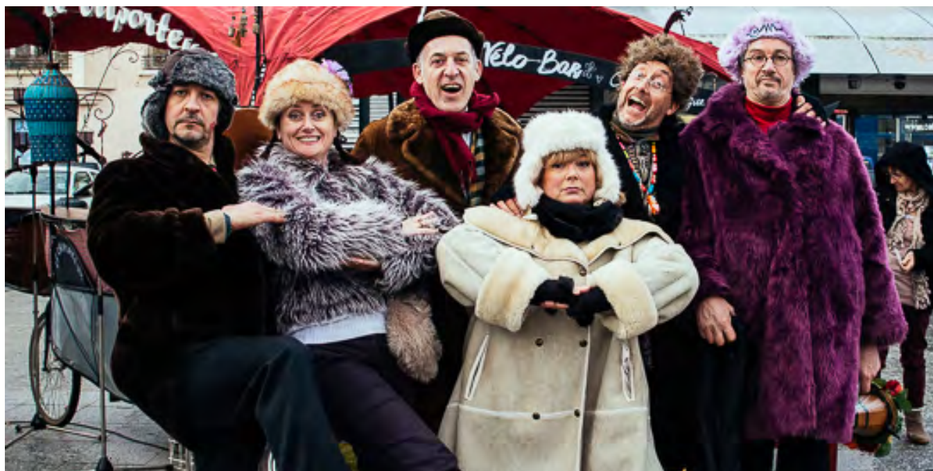
Festival É-criez votre amour, 2014

Fonctionnant telle une compagnie théâtrale, où les complicités se croisent, le Criporteur regroupe des artistes confirmés et rodés à l'improvisation, à la mise en scène, à l'écriture et au spectacle de rue. En fonction des projets, nous travaillons avec plus de 15 artistes chaque année.