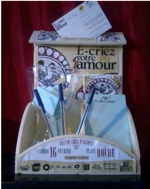
La boîte à message de la quatrième édition, à Rennes, présente dans tous les lieux partenaires

Notre démarche est de placer le public au cœur de l'évènement, ici lui donner l'opportunité de s'exprimer de façon spontanée par le jeu de l'écriture.