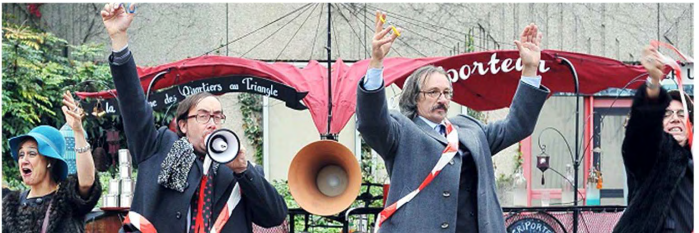
Inauguration du Vélobar au Triangle Septembre 2012